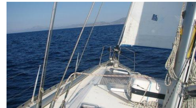
Privatyachting - Skipper mieten - Segeltouren - Spaß - Freude